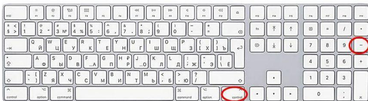
Способ ввода тире

8.2. Способ ввода тире: Ctrl + минус на цифровой клавиатуре.