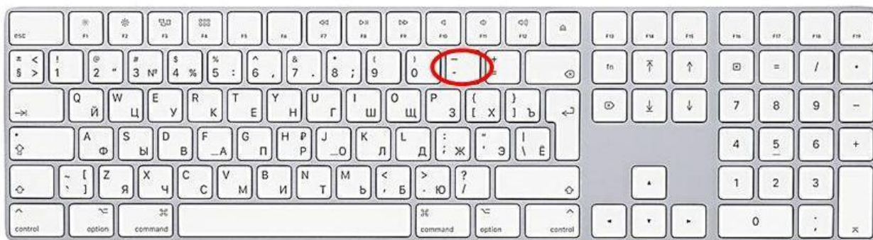
Способ ввода дефиса

7.2. Клавиша для ввода знака «дефис» расположена в верхнем цифровом блоке, делящая клавишу со знаком нижнего подчеркивания (нижний дефис).