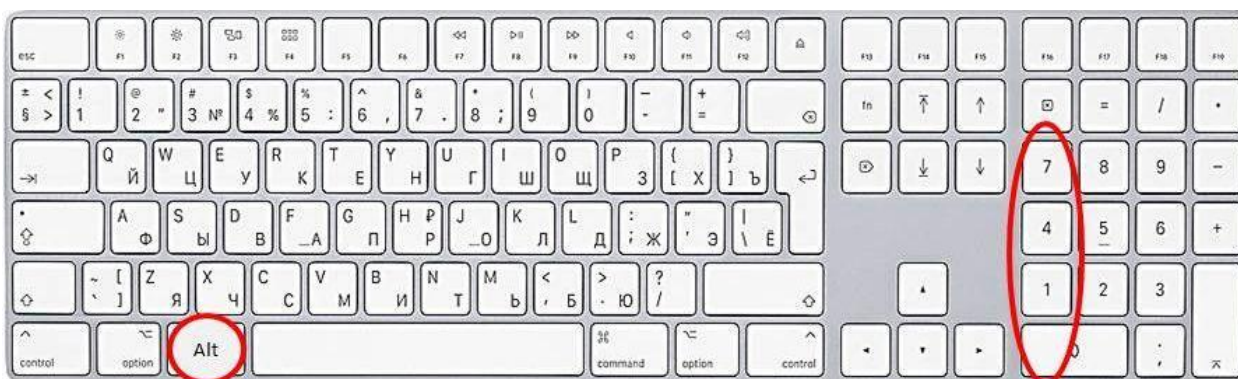
Способ ввода открывающихся кавычек “лапки”

9.2. Если внутри текста, выделенного кавычками, содержится другой текст, требующий кавычек, он оформляется кавычками типа “лапки” (ЗАО «Издательский дом “Комсомольская правда”»). Для набора кавычек “лапки” нажимается клавиша Alt , набирается 0147 , затем отпускается Alt – получаем открывающиеся кавычки “лапки”. Нажимается Alt , набирается 0148 , отпускается Alt – получаем закрывающиеся кавычки “лапки”.