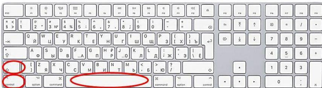
Способ ввода неразрывного пробела

6.1. Чтобы контролировать употребление неразрывного пробела, необходимо осуществлять набор и вычитку текста в режиме, когда показаны все непечатаемые символы, который включается при нажатии клавиши ¶ на панели инструментов.