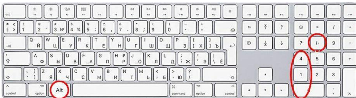
Способ ввода закрывающихся кавычек “лапки”